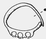
orecchino rinvenuto presso il Sagrato della Basilica

Il legame dei muggesani con il patriarcato si mantenne saldo per tutto il medioevo, finché ad esso si venne a sostituire nel XIII secolo l'attrazione verso la repubblica veneziana, un lento processo giunto a compimento con la caduta dello stato patriarcale (1420). Un segno della naturale attrazione verso il potere marittimo veneziano fu dato, già nel trecento, dallo spostamento del centro abitato dal colle verso la costa, il Burgus Lauri che costituisce l'odierno centro di Muggia. Questo avvenne anche in seguito ad una serie di distruzioni del vecchio abitato, dovute ad episodi bellici e legate alle rivalità con il vicino Comune di Trieste.